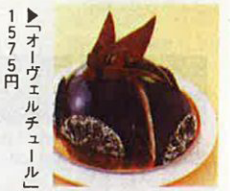
1575円 ▲「オーヴェルチュール」